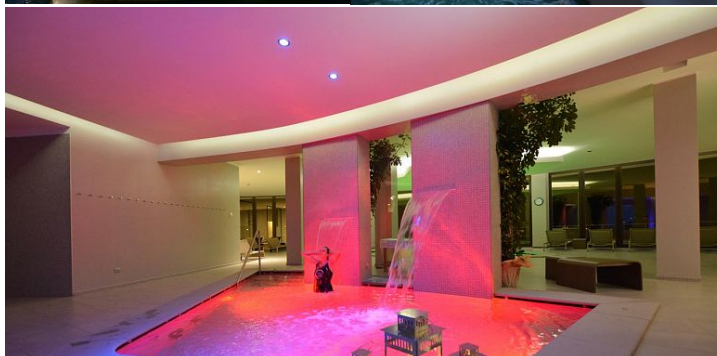
Terme di Saint Vincent